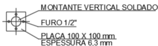
Figura 5: Detalhe fixação

Vejamos abaixo algumas orientações conforme recomendação da NR-12: